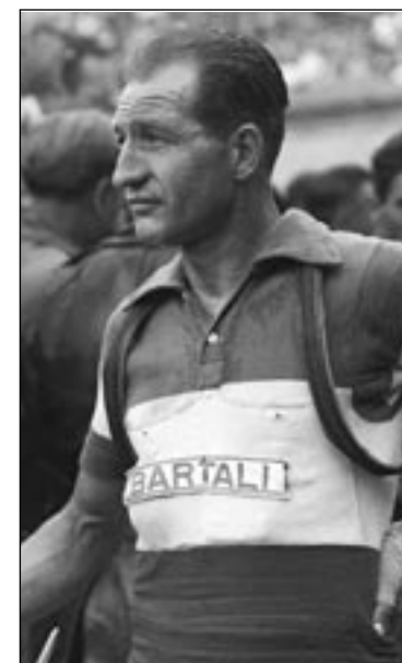
Gino Bartali dopo una corsa

rese. In quei lunghi trasferimenti su e giù per il Belpaese Ciocchetta ebbe modo di conoscere profondamente il carattere di Bartali e i rapporti tra i due divennero sempre più stretti tanto che la sua testimonian-