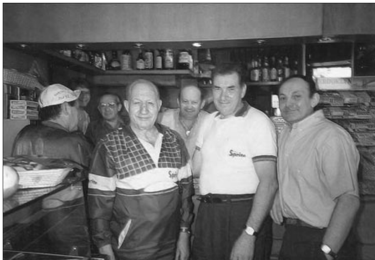
Bartali in un bar di Nogara con Ciocchetta e alcuni avventori

Maggio è il mese del Giro d'Italia, una delle più prestigiose gare di ciclismo del mondo. Uno dei massimi rappresentanti di questo sport ebbe un legame particolare con Nogara: si tratta di Gino Bartali, scelto sul finire degli anni Settanta dai dirigenti della Coca Cola, operante in paese da poco, per pubblicizzare la bibita Sprite in giro per l'Italia. Al suo fianco, per tredici edizioni del Giro, ci fu Lino Ciocchetta, ex ciclista professionista nativo di Ca' di David, residente a Nogara e dipendente della multinazionale americana. La vicenda sportiva di Bartali ci riporta nell'immediato secondo dopoguerra, quando il dualismo con Coppi spaccava a metà gli italiani. La figura di Bartali rappresentava quella dai genuini sentimenti cattolici (anche in questo opposto al socialista Coppi), simbolo di un paese contadino e conservatore: le due facce dell'Italia di allora, insomma. Quando la carovana del Giro passava per i paesi, una folla festante era assiepata ai margini delle strade per assistere all'eccezionale avvenimento. Nel 1949 è stata l'ultima volta che i nogaresi poterono applaudire, da corridore, il grande Bartali, soprannominato Ginettaccio per via del suo carattere e arrivato ormai alla fine di una carriera