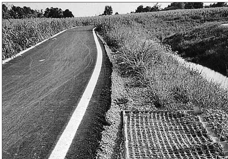
Un tratto della pista ciclopedonale privo di protezione. È ben visibile lo strato di calcestruzzo e asfalto dell’opera