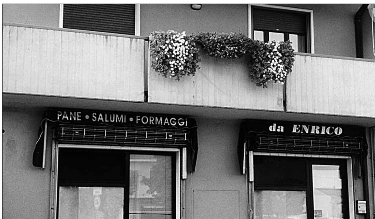
La bottega di alimentari che ha chiuso definitivamente i battenti

Un segnale negativo per economia e società