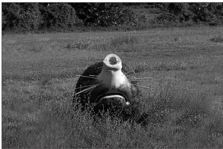
Una talpa gigante fatta con materiali riciclati

La campagna segue di alcuni mesi l'approvazione del P.e.b.a. (Piano di eliminazione delle barriere architettoniche) da parte del Comune di