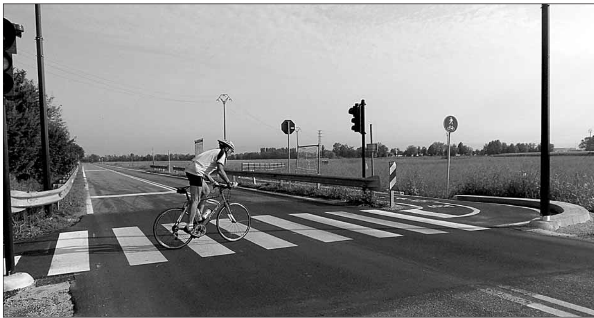
L’incrocio tra la pista ciclo-pedonale delle risorgive e la circonvallazione est di Povegliano Veronese

N on sarà forse un modello ideale di pista ciclopedonale quella detta “delle risorgive”, che da San Giovanni Lupatoto arriva a Valeggio sul Mincio per congiungersi con quella Peschiera-Mantova, ma rappresenta già una realtà apprezzata da coloro che la percorrono anche prima che venga inaugurata ufficialmente. Qualcuno storce il naso osservando che essa è composta da due strati sovrapposti di cemento ed asfalto (in Europa la maggior parte delle piste ciclabili sono in terra battuta, anche per mantenere permeabile il suolo). Qualcun altro afferma che bisogna guardare alla sostanza positiva di un’opera in un territorio i cui comuni non sono riusciti finora a realizzare una pista ciclabile tra un centro e le frazioni o le zone industriali e nemmeno un anello completo, ma solo tratti che iniziano e finiscono nel nulla, dunque poco utili e poco sicuri per gli utenti. Questa zona ha forse un primato negativo per la brevità dei pezzi di piste ciclabili, espressione di interventi estemporanei non inseriti in un quadro organico. Ora invece con questa pista un ciclista potrà andare, senza dover stare attento a non essere travolto da una