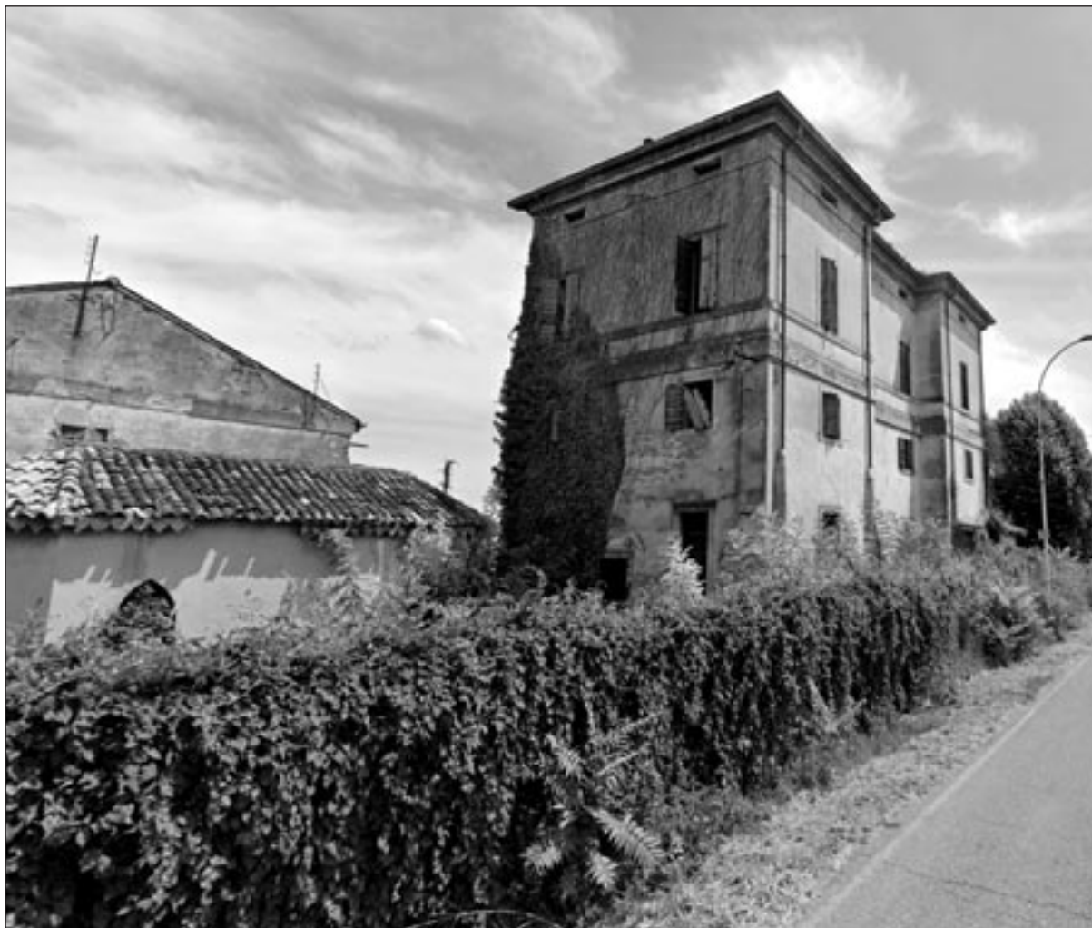
Parte esterna dei fabbricati di corte Treves in stato di degrado e aggrediti dalla vegetazione