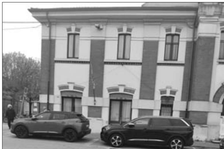
La sede del Centro in Piazza Garibaldi