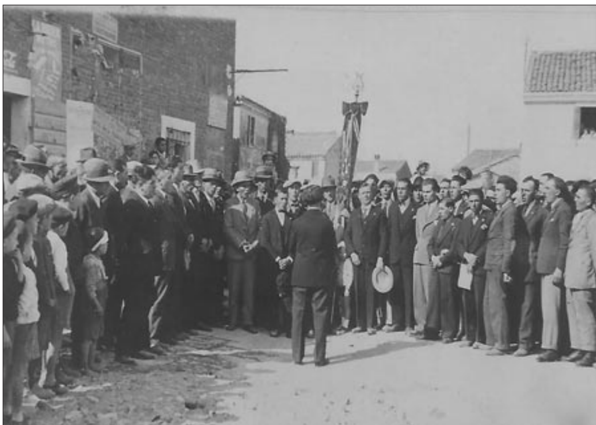
La Corale Euterpe si esibisce davanti all'osteria cooperativa a Caselle di Nogara dopo la scoperta di una targa nel ventennale della fondazione (anno 1926)

Costituita nel 1906 e sciolta nel 1956 si esibì in concorsi nazionali e internazionali