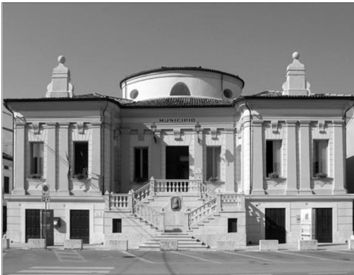
Il municipio di Castel d'Ario (Mantova) edificato nel 1780