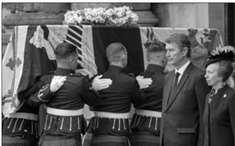
La bara di Elisabetta II d'Inghilterra scomparsa all'età di 96 anni