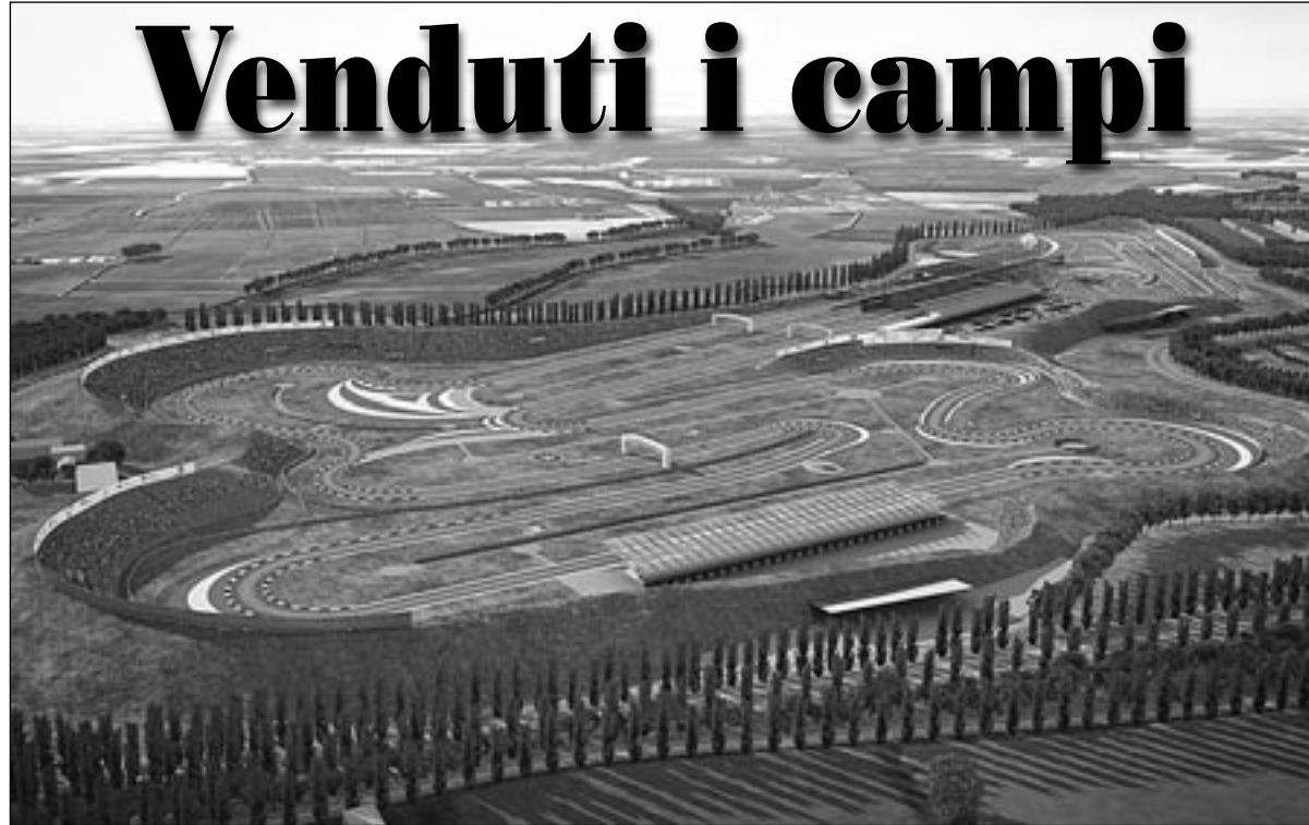
Veduta virtuale del Motorcity